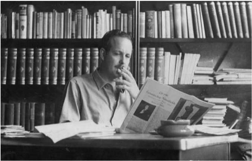
Gretig lezer van alle denkbare media.